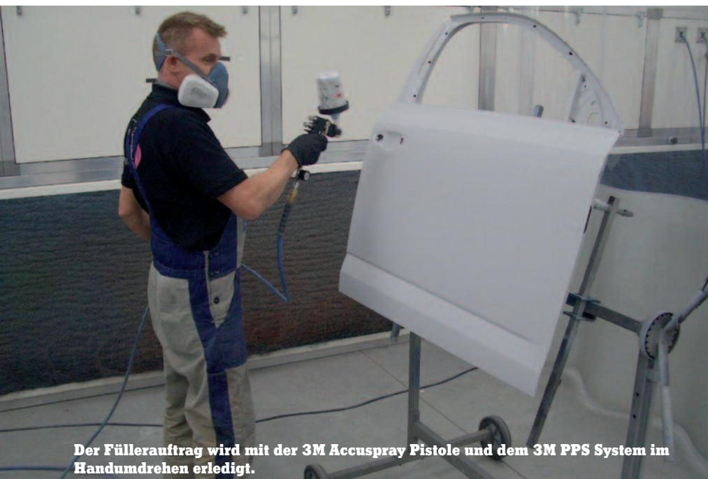
Der Füllerauftrag wird mit der 3M Accuspray Pistole und dem 3M PPS System im Handumdrehen erledigt.

Bewährt hat sich beim Füllerauftrag die Einführung des 3M-Accuspray-Systems mit den PPS-Bechern. Nach anfänglicher Skepsis hat die druckluftbetriebene Füllerpistole in Kombination mit dem charakteristischen Beutel im Becher-System die Mitarbeiter überzeugt.