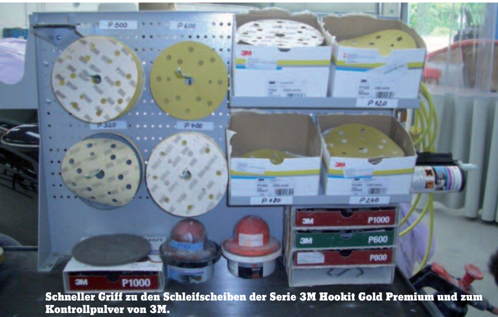
Schneller Griff zu den Schleifscheiben der Serie 3M Hookit Gold Premium und zum Kontrollpulver von 3M.