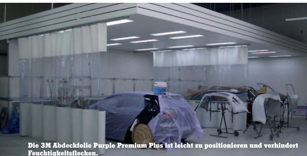
Die 3M Abdeckfolie Purple Premium Plus ist leicht zu positionieren und verhindert Feuchtigkeitsflecken.