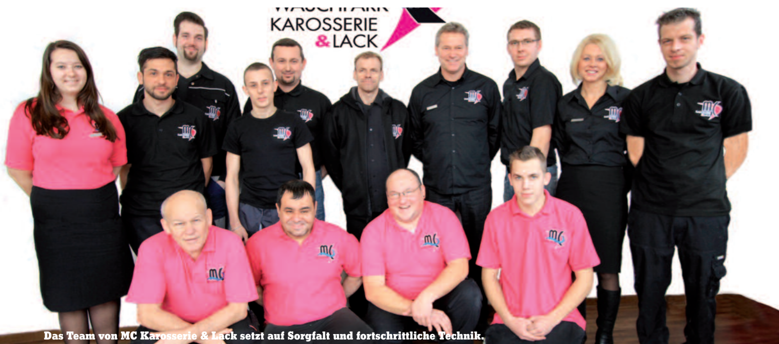
Das Team von MC Karosserie & Lack setzt auf Sorgfalt und fortschrittliche Technik.

gann, ist eine echte Erfolgsgeschichte – und die hat mit einer pfiffigen Idee und der Unterstützung durch 3M zu tun.