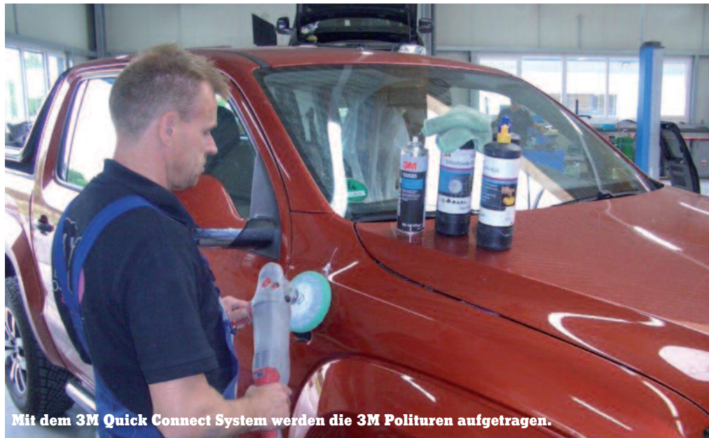
Mit dem 3M Quick Connect System werden die 3M Polituren aufgetragen.

Doch nicht nur das: Um den Privatkundenanteil des Lackier- und Karosseriebetriebs zu steigern, entstand darüber hinaus gleich noch ein hochmoderner Waschpark. Die Idee dahinter: Nach der Autowäsche werden unschöne Beulen, Kratzer und Dellen erst so richtig